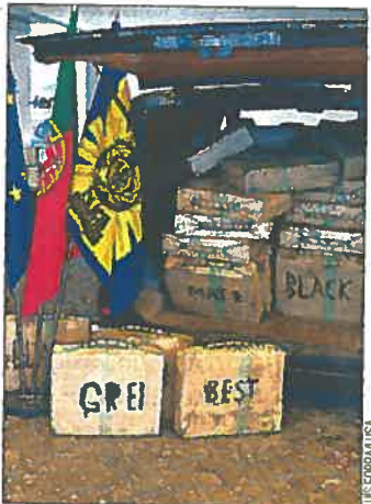
Haxixe foi apreendido pela PJ

O Ministério Público tinha pedido, na última sessão, a condenação da rede suspeita que, na noite de 23 de fevereiro do ano passado, descarregou mais 70 fardos de haxixe (2100 quilos) de uma embarcação para uma carriinha, na zona das Quatro Águas, em Tavira, antes de ter sido desmantelada pela Polícia Judiciária. No decorrer do julgamento, os sete arguidos negaram as acusações e qualquer envolvimento na rede de tráfico de droga, e garantiram que apenas estavam a pescar naquele local na noite em que foi feita a descarga da droga, vinda de uma embarcação semirrigida, que entretanto conseguiu escapar e que se presume que tenha viajado do Norte de África. A sessão de julgamento está marcada para as 15h00. ■T.G.