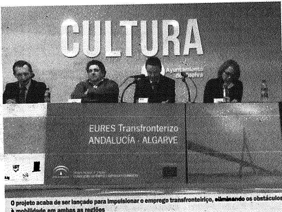
O projeto acaba de ser lançado para impulsionar o emprego transfronteiriço, eliminando os obstáculos à mobilidade em ambas as regiões

O projeto tem como promotores o Serviço Público de Emprego Estatal (SEPE) e o seu homólogo de Portugal, o Instituto do Emprego e Formação Profissional (IEFP), e conta com vários parceiros do lado espanhol e português. Do lado nacional, a parceria estende-se à As-