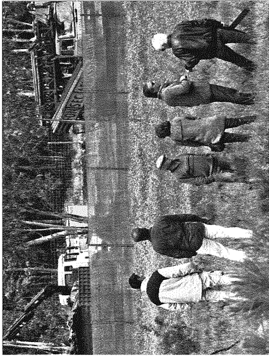
ro em terreno de Aljezur, que suscitou suspeitas dos grupos contra o petróleo, era apenas para captação de água