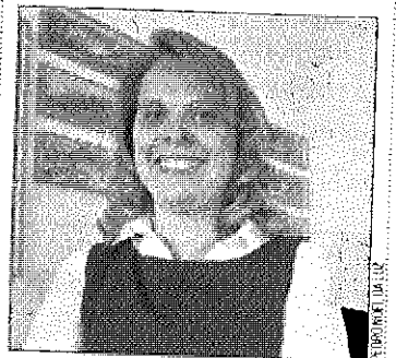
Presidente Rosa Palma

14% dos imóveis encontram-se em mau estado