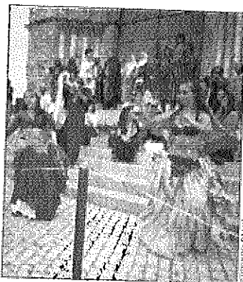
Feira Medieval em Silves

O projeto está disponível para consulta no site do município. A autarquia sublinha a importância, para o sucesso da feira, da participação das coletividades de Silves e dos artesãos e pequenos produtores. ● AP.